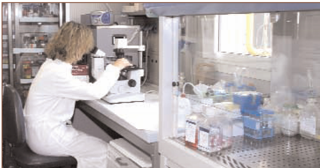
Un laboratorio di ricerca dell'Associazione Atena fondata dal prof. Giulio Maira

cerca: su cellule staminali per la rigenerazione dei tessuti, cellule staminali tumorali, genetica degli aneurismi intracranici, impiego dei laser in neurochirurgia, uso di nanotecnologie. Queste ultime forniscono particelle attraverso le quali inviare farmaci o terapie alle cellule. In questo progetto collaboriamo con il CNR di Firenze. Usiamo nanoparticelle di oro che, colpite dal laser, liberano fortissime energie che sfruttiamo per saldare i tessuti e per inviare anticorpi e farmaci a bersagli come cellule tumorali da distruggere. È una tecnologia estremamente avanzata che potrebbe sostituire la chemioterapia.